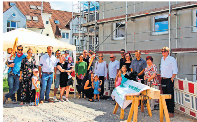
Glückliche Bauherren beim Richtfest

Die Preise für ein bezugsfertigtes Haus inklusive einem rund 174 Quadratmeter großen Grundstück und Par-